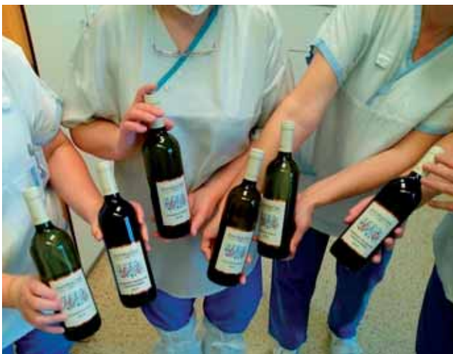
Poděkování sestřiček z infekčního oddělení

Reakce obdarovaných byly a stále jsou velmi spontánní, radostné a pro nás velmi potěšující. Lékaři i další zdravotníci pracovníci telefonují, píšou mailly i sms zprávy, ať už jen s poděkováním za vína, s vyjádřením příjemných pocitů z milého a nečekaného překvapení, ale také s chválou kvality našich konkrétních vín, což nás obzvláště mimořádně těší. Sestřičky z nemocnic se fotí s našimi víny a tyto fotografie sklízejí další velký zájem i pochvalné reakce na sociálních sítích. Velmi příjemné bylo i osobní poděkování ředitele Nemocnice Kyjov při krátkém setkání se společnou fotografií s darovací smlouvou, i když v respirátorech a za dalších mimořádných opatření. Za všechna možná poděkování si vzpomínám na jednu z prvních bezprostředních reakcí: „Pracuji jako fyzioterapeut v nemocnici a moc ráda bych Vám poděkovala za rozsvícení dnešního dne. Dostala jsem od října loňského roku do konce března darovali téměř 12.000 lahví našich vín v celkové částce téměř 2,3 mil. Kč.“